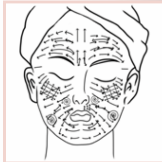
PHASE III Balayage linéaire long visage

Technique en croisement pour l'application du Silver Peel