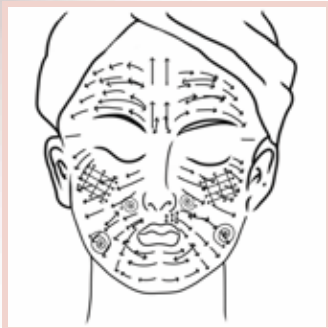
PHASE I Balayage linéaire court visage + cou