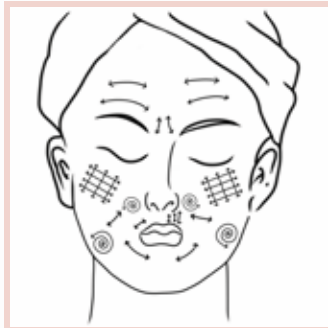
PHASE II Balayage quadrillé, "effaçage", circulaire Zones spécifiques